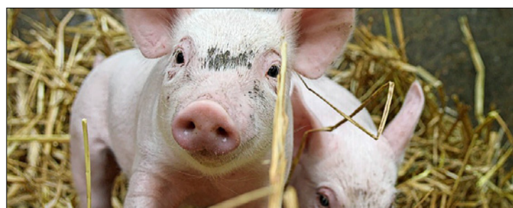
Saugferkel standen im Kurs im Zentrum.

Seit 2016 vertiefen Tierärzte in einem praktischen Kurs zur Hofsektion beim Schwein ihr Wissen und ihre Fertigkeiten in diesem Thema. Die Schweizerische Vereinigung für Schweinemedizin (SVSM) organisiert die Kurse. Seit dem Start des Programms wurden 16 Kurse durchgeführt, und 41 Tierärzte haben das Fertigkeitzeugnis erworben. Inzwischen wurde das Kursprogramm auf vier Module erweitert, zu ZoE (zielorientierte Entnahme von Proben) umbenannt und Teilnehmer erhalten